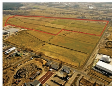
ul. Wawelska, tereny podstrefy Pomorskiej Specjalnej Strefy Ekonomicznej