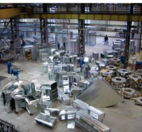
Hala produkcyjna Karpol Sp. z o.o.

Piła to intensywnie i systematycznie rozwijający się ośrodek gospodarczy. Dynamiczny rozwój miasta i otwartość dla nowych wyzwań sprawiają, że Piła jest optymalnym miejscem do prowadzenia różnorodnej działalności gospodarczej.