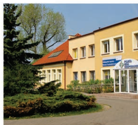
Instytucje otoczenia biznesu

Państwowa Wyższa Szkoła Zawodowa im. Stanisława Staszica w Pile, największa uczelnia publiczna w Północnej Wielkopolsce, prowadzi inwestycję w kapitał ludzki, zyskując dla swoich działań szerokie wsparcie organizacyjne (lokalowe, finansowe) ze strony tutejszych władz samorządowych.