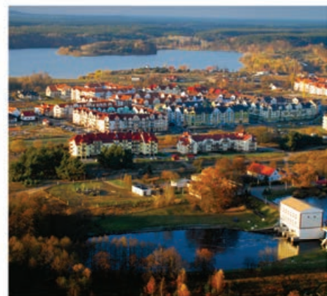
Osiedle Koszyce – nowoczesna zabudowa mieszkaniowa

Położenie lotniska w Pile umożliwia szybki kontakt gospodarczy z firmami regionu Północnej Wielkopolski i całej Europy oraz stwarza możliwość rozbudowy infrastruktury technicznej związanej z lotnictwem.