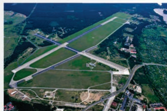
Lotnisko w Piłe