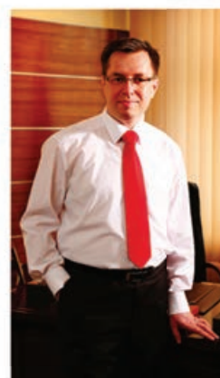
Zapraszam do Piły