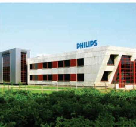
Philips Lighting Poland SA