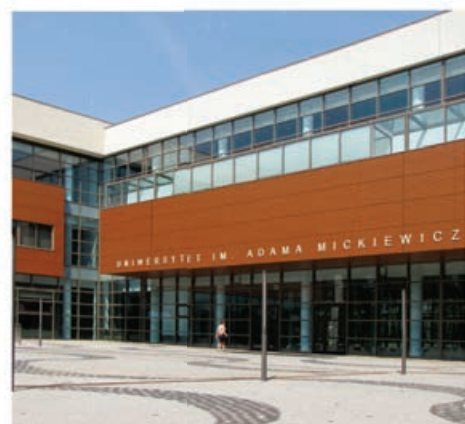
Uniwersytet im. Adama Mickiewicza Zamiejscowy Ośrodek Dydaktyczny w Pile